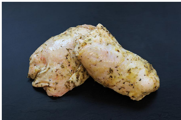
haut de cuisse1.jpg